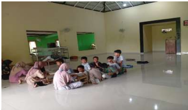
Gambar .1. Pengajaran Siswa Yang Belum Bisa Baca Al-Qur`An

Temuan ini mengindikasikan bahwa sebagian siswa masih memerlukan bimbingan intensif di tahap awal membaca sebelum mereka bisa difokuskan pada kegiatan menghafal Al-Qur'an. Karena itu, penguatan keterampilan membaca merupakan langkah awal yang sangat penting dan strategis dalam menunjang keberhasilan program tahfidz di lingkungan pendidikan.