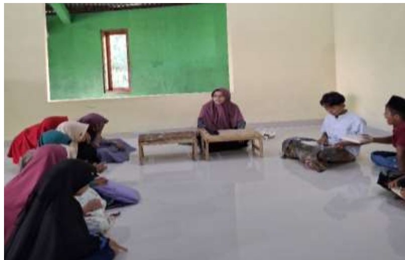
Gambar .3. Mengajari Siswa Cara Menghafal Al-Qur`An.

Berbagai hasil penelitian menunjukkan bahwa metode Al-Qosimi efektif dalam meningkatkan kemampuan hafalan Al-Qur'an siswa dan mendukung terbentuknya generasi Qur'ani yang mandiri serta berprestasi. Metode ini juga terbukti dapat diterapkan secara luas, baik pada anak-anak maupun orang dewasa, dengan tetap berpegang pada tahapan yang telah disusun secara sistematis (Intani, R. 2018) (Al Muiz & Umatin, 2022). Dengan demikian, bagi siswa yang telah memiliki kemampuan membaca Al-Qur'an yang baik, metode Al-Qosimi menjadi pilihan yang tepat untuk membangun hafalan yang berkualitas dan berjangka panjang. Perpaduan antara penyempurnaan tajwid, pengulangan intensif, dan sistem tahapan yang terstruktur menjadikan metode ini efektif dalam menghasilkan hafalan yang kuat sekaligus menumbuhkan kecintaan siswa terhadap Al-Qur'an.