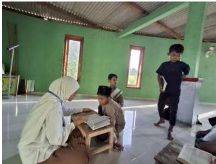
Gambar .2. Mengajari Siswa Iqra`

Setelah santri mulai menunjukkan kelancaran dalam membaca, proses pembelajaran berlanjut ke tahap permulaan menghafal Al-Qur'an dengan menerapkan metode talqin, yaitu guru melafalkan ayat Al-Qur'an secara pelan dan benar, kemudian santri menirukannya berulang-ulang. Tahapan ini dilakukan secara bertahap, dimulai dari potongan ayat pendek hingga satu ayat utuh, hingga santri mampu melafalkannya tanpa melihat mushaf. Pengulangan yang dilakukan secara konsisten turut memperkuat daya ingat pendengaran dan pelafalan lisan santri, sehingga hafalan yang terbentuk menjadi lebih kokoh dan stabil. Dengan demikian, perpaduan antara metode Iqra' dan talqin tidak hanya memperkuat aspek membaca, tetapi juga menjadi landasan yang kuat dalam menumbuhkan kemampuan menghafal Al-Qur'an sejak usia dini.